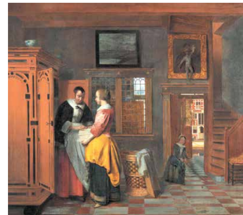
Interieur met moeder en dochter bij de linnenkast. Schilderij door Pieter de Hooch, 1663. (Rijksmuseum)

moeders en weduwen – bij de 17de-eeuwse Friese elite. Antropologen zijn meer dan historici gewend te denken in termen van familie- en verwantschap, van ritueel en ceremonie; historici zijn vaak meer vertrouwd met juridische kaders en met politieke en economische machtsbronnen. Maar wie de context wil begrijpen van het optreden van een elite als de Friese adel in de Vroegmoderne tijd (grotfweg 1500 tot 1800) zal oog moeten hebben voor haar drie invloedssferen: macht, welstand en status. Die waren in de 17de eeuw nog nauw met elkaar verstrengeld.